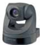
Tabla comparativa de cámaras robotizadas SD y Full HD*