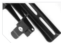
Cierre de seguridad