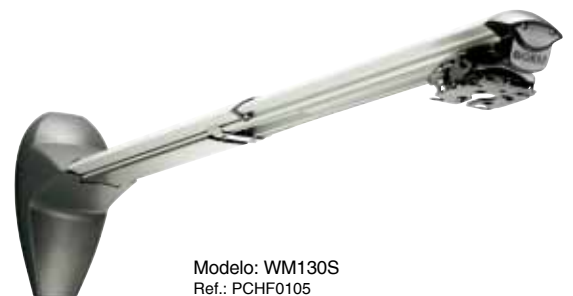
Modelo: WM130S Ref.: PCHF0105