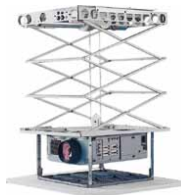
Ref.: PCEY0002 Soporte para falsos techos