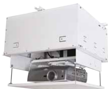
Ref.: PCHF0156 Soporte motorizado SL151