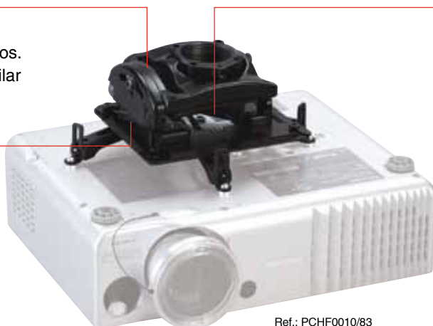
Ref.: PCHF0010/83 Soporta hasta 22,7 kg