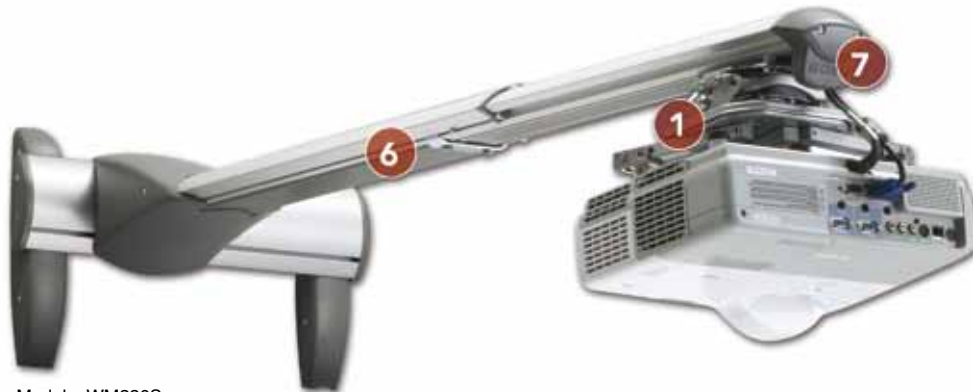
Modelo: WM230S Ref.: PCHF0106

Nuestra amplia gama de soportes de pared universales para proyectores de corto alcance proporcionan una flexibilidad, precisión y robustez inigualables. Garantizan instalaciones rápidas, seguras y con una precisa alineación.