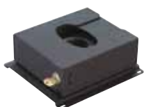
Ref.: PCHF0029 Cerradura PL2 para soportes de proyectores.