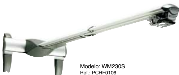
Modelo: WM230S Ref.: PCHF0106