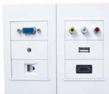
Ejemplo de montaje Modelo: HMCO0023