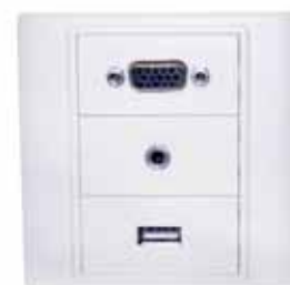
Ejemplo de montaje Modelo: HMCO0026