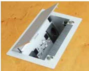
Caja de conexión empotrada en mesa