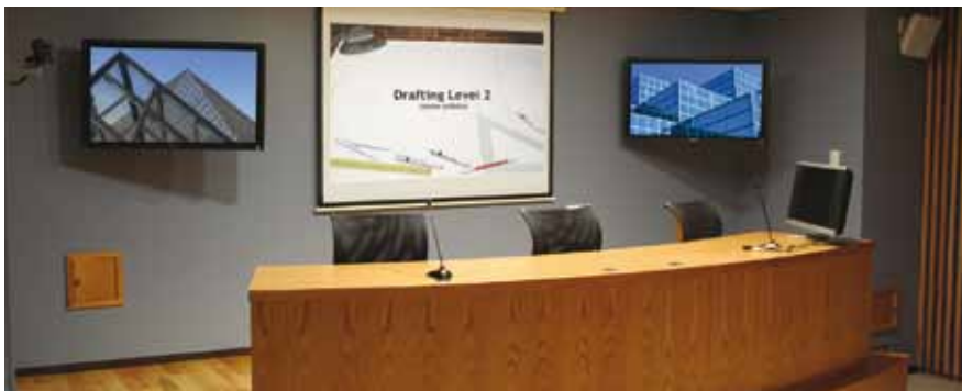
Sala de conferencias con sistema de control

Las cajas de conexiones empotrables en mesas son la solución perfecta para salas de formación y salas de conferencia.