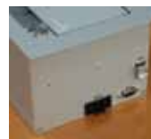
Caja en superficie